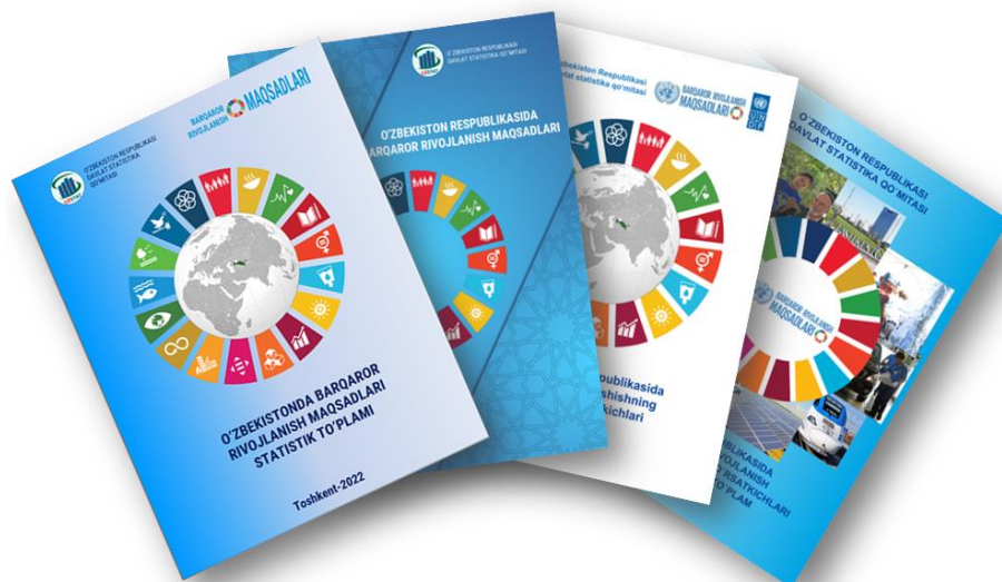
3-rasm. O'zbekiston Respublikasida Milliy BRMLarga erishish bo'yicha statistik ko'rsatkichlar to'plamlari

ko'rsatkichlar to'plamlari" uch tilda (rus, o'zbek va ingliz tillarida) tayyorlangan va nashr etilgan (3-rasm).