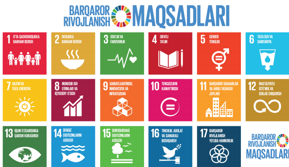
2-rasm. Barqaror rivojlanishning global miqyosda erishilishi rejalashtirilgan 17 ta maqsadi

Ushbu veb-sayt konsepsiyasi sohadagi eng ilg'or texnologiyalar va uslubiy ishlanmalar, shuningdek, so'nggi yangiliklarni hisobga olgan holda ishlab chiqilgan. Milliy barqaror rivojlanish maqsadlari veb-sayti O'zbekistonning barqaror rivojlanish maqsadlari bo'yicha yutuqlarni tahlil qilish va kuzatishda milliy va xalqaro foydalanuvchilar uchun yagona va ishonchli ma'lumotlar manbasi hisoblanadi.